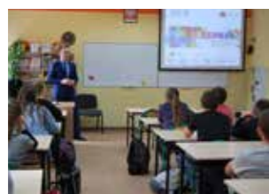
Lekcja BAKCYL w ZSG nr 7 w Radomsku