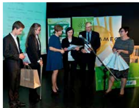
Projekt edukacyjny I LO w Radomsku w ramach Różewicz OPEN Festiwal

ESBANK Bank Spółdzielczy rozumie potrzeby lokalnego środowiska, którego część stanowi. Dlatego wspiera aktywizację i rozwój lokalnej społeczności, realizując w praktyce społeczną misję polskich banków spółdzielczych. W 2016 roku, tak jak w latach ubiegłych, Bank aktywnie zaangażował się w ponad 70 inicjatyw szkół, przedszkoli, organizacji pozarządowych, instytucji i jednostek samorządowych z terenu swojego działania. Współpraca obejmowała projekty i konkursy edukacyjne oraz artystyczne, a także działania integru-