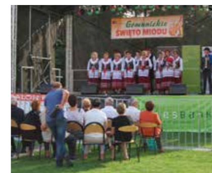
Gomunickie Święto Miodu