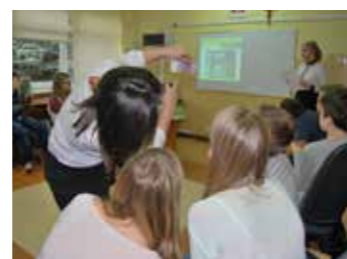
Lekcja SKO w PSP nr 5 w Radomsku