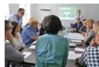
Projekt zakładał konsultacje i ankiety wśród Klientów i Pracowników

informacji w ESBANKU Banku Spółdzielczym. Działanie współfinansowała Szwajcaria w ramach szwajcarskiego programu współpracy z nowymi krajami członkowskimi Unii Europejskiej. Efektem projektu było usprawnienie procesów wewnętrznych oraz poprawa komfortu pracy kadry naszego Banku, a także zmniejszenie zużycia papieru i energii elektrycznej. Na realizację projektu Bank pozyskał w konkursie ogłoszonym przez Polską Agencję Rozwoju Przedsiębiorczości 12 393 CHF.