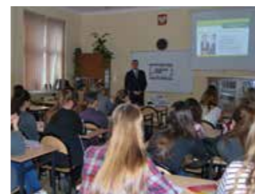
Projekt „Biznes przy tablicy” w II LO w Radomsku

Edukacja finansowa to jeden z priorytetów w działalności społecznej ESBANKU Banku Spółdzielczego. Czujemy się odpowiedzialni za budowanie zaufania do sektora bankowego i za to, aby społeczeństwo z produktów i usług bankowych korzystało w sposób świadomy i bezpieczny. Wiemy też, że naukę dobrych praktyk oraz umiejętności poruszania się w świecie codziennych finansów warto zaczynać jak najwcześniej. Dlatego od lat współpracujemy ze szkołami z terenu naszego