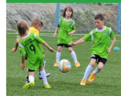
ESBANK RAP Radomsko rocznik 2007 - Youth Football Festival na Węgrzech