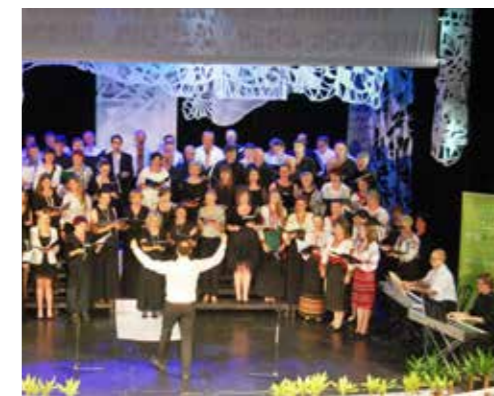
Międzynarodowy Festiwal Chóralny „Wschód-Zachód-Zbliżenia”