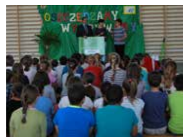
Podsumowanie Konkursu SKO w Jedlnie