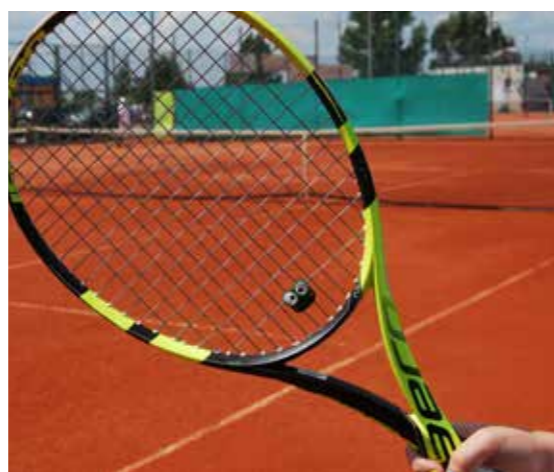
Turniej tenisa dla dzieci Fundacji Aktywności Fizycznej w Radomsku