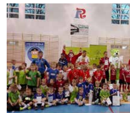
VII Mikołajkowy ESBANK CUP

Współdziałanie i rywalizacja w duchu fair play – to kwintesencja szlachetnego sportu. To także idee, na których zbudowana została siła polskiej bankowości spółdzielczej. Dlatego ESBANK Bank Spółdzielczy od lat wspiera sportowy rozwój dzieci i młodzieży. Także w 2016 roku współpracowaliśmy w sumie z 10 lokalnymi klubami sportowymi. Wśród nich był klub koszykarski MKS JUNAK Radomsko, kluby i szkoły piłkarskie, w tym szósty rok z rzędu Radomszczańska Akademia Piłkarska, sekcja zapaśnicza i tenisa stołowego UMLKS Radomsko oraz szkoły tenisa