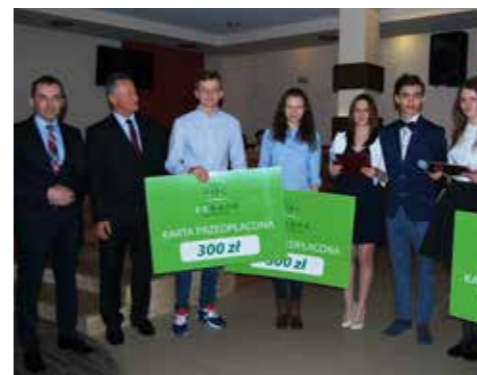
Konkurs ZSE w Radomsku „Bądź przedsiębiorczy”