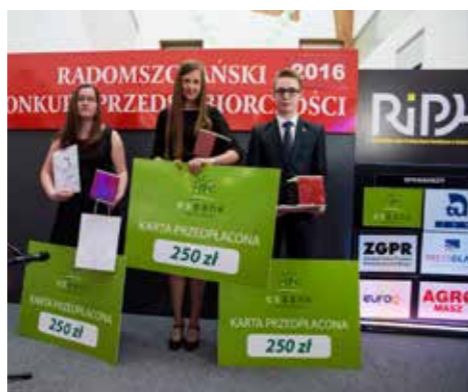
Konkurs RIPH w Radomsku „Pomysł na biznes”

jące lokalną społeczność, takie jak Radomszczańskie Dni Rodziny, Spotkania Chóralne, obchody Dnia Seniora, Dni Radomska, Święto Ziemniaka w Kodrębie czy Ogólnopolski Harcerski Festiwal Artystyczny „Opal”, którego organizację wspólnie z ESBANKIEM Bankiem Spółdzielczym wspomógł SGB-Bank Spółdzielczy. Za wspieranie idei rozwoju osób niepełnosprawnych po raz drugi ESBANK Bank Spółdzielczy został uhonorowany przez Specjalny Ośrodek Szkolno-Wychowawczy w Radomsku Biedronką Dobroczynności.