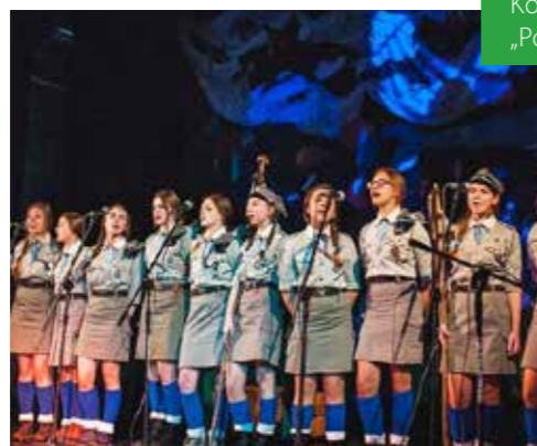
Festiwal Harcerski „OPAL”