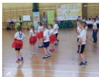
XII Olimpiada dla Przedszkolaków w Pajęcznie