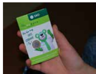
Książeczka członka SKO