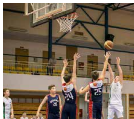
ESBANK Junak w Radomsku