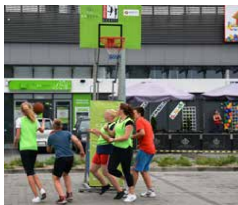
VIII ESBANK Streetballmania w Radomsku