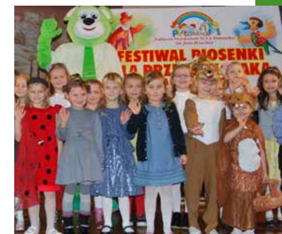
Festiwal Piosenki dla Przedszkolaka