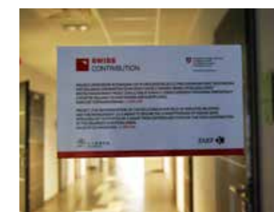
Siedzibą projektu była Centrala Banku w Radomsku